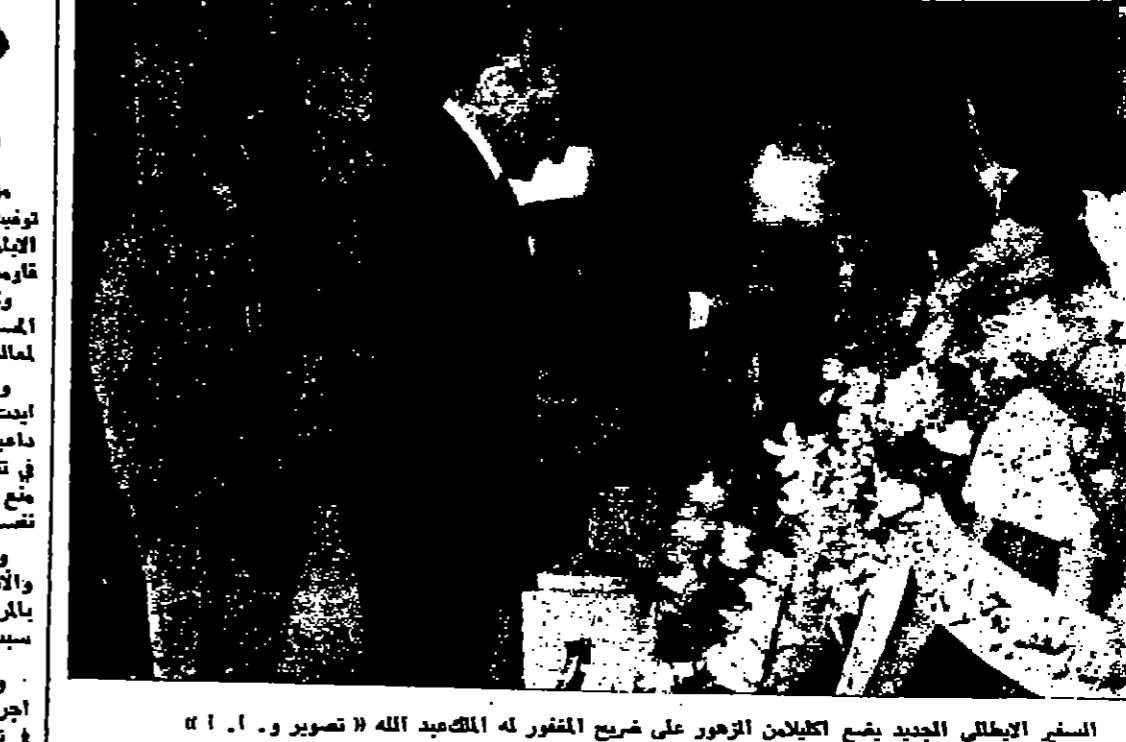
السيرة الإيطالية الجديدة يضح كليلان الزهور على ضريح المقبرة له المكعب الله

وقالت امس وكالة الانباء الفرنسية ان السر والاس قد اكتشفت اصابة السر والاس بالسرطان اثناء اجراء فحص طبي لها في سنة ١٩٦٦.